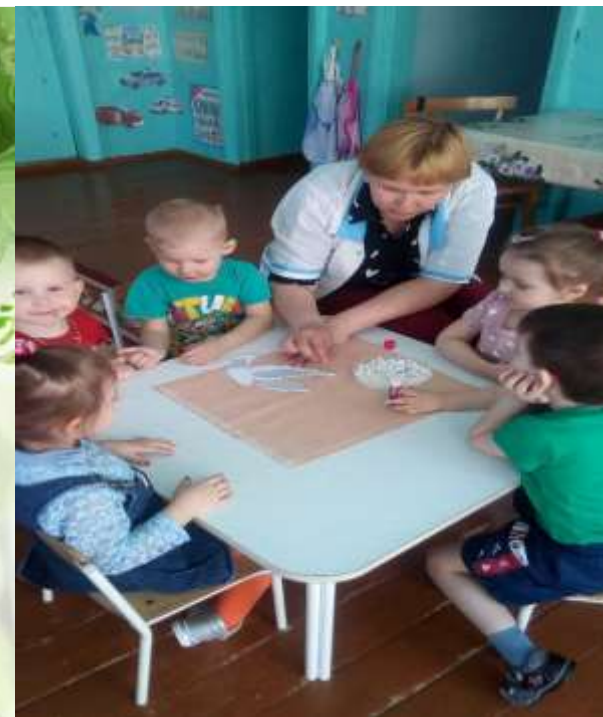
Участие в районной Акции «Ленточка памяти». районном фестивале-конкурса «Весна 45-го года»